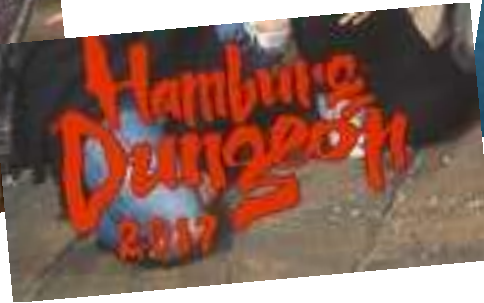
Gruselig und unterhaltsam, das Hamburg Dungeon