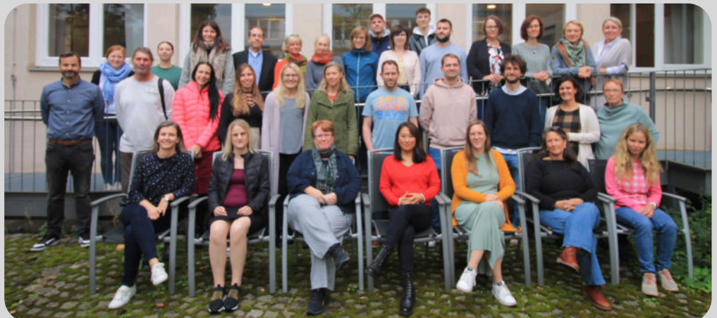
Team des IPSN im SJ 2024/25