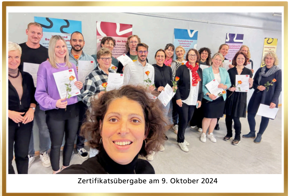
Zertifikatsübergabe am 9. Oktober 2024

Die gemeinsam erstellten Unterrichtsentwürfe werden den beruflichen Schulen zeitnah zur Verfügung gestellt; ein Netzwerk für den weiteren Austausch ist in Planung. Bei Interesse an einer Mitarbeit wenden Sie sich an Diana Liberova ( diana.liberova@stadt.nuernberg.de )