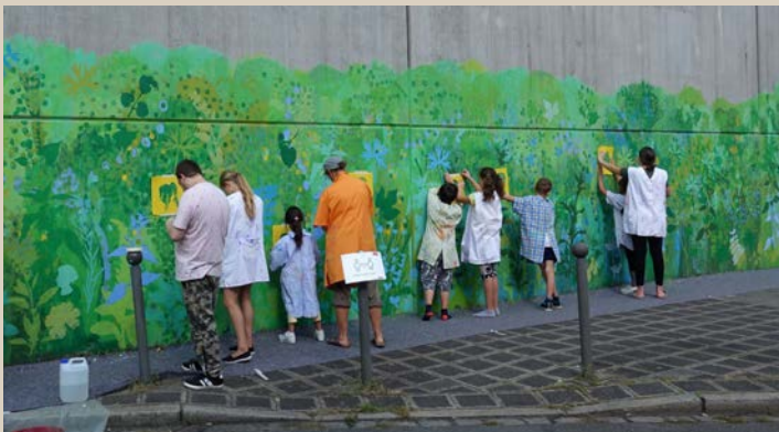
Wandgestaltung zusammen mit Anwohnenden

Gefördert wurde die Umgestaltung aus dem Programm „Klein aber Fein“ der Städtebauförderung. Am Freitag, den 19. Juli kamen Anwohner und Interessierte des Quartiers zusammen, um mit dem Leiter des Stadtplanungsamtes, dem Quartiersmanagement und der Künstlerin die offizielle Eröffnung des Pocket Parks zu feiern.