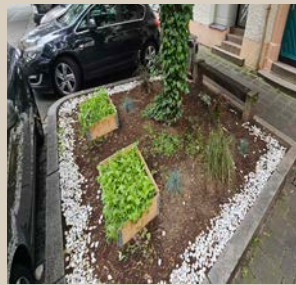
Neue Pflanzkübel und Beete

Abschließend ist Ende September ein Grillfest geplant, um intensiver mit den Anwohnenden ins Gespräch zu kommen.