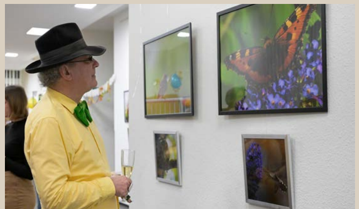
Besucher des Jahresempfangs und der Vernissage

Er hat einen Verein gegründet mit dem Namen GANG e.V. Gerne lässt er Sie an seinen Naturbeobachtungen, Geschichten und Erlebnissen teilhaben oder gibt Tipps für das Beobachten und Fotografieren.