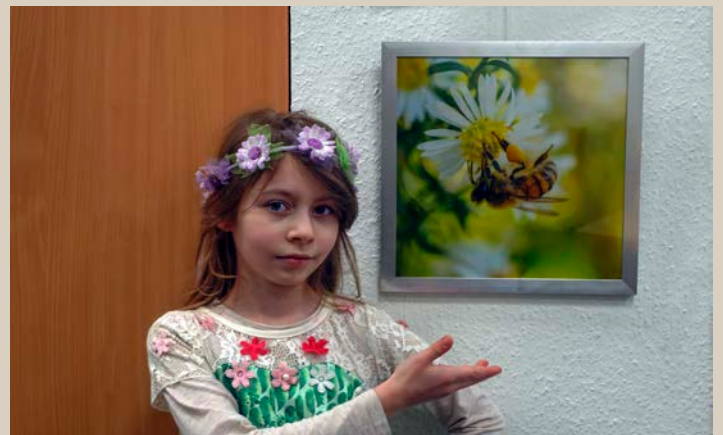
Aura präsentiert die Kunstwerke

Ästhetisch ansprechende und qualitativ hochwertige Fotos zeigten Blumen, Pilze, Insekten, Vögel, Tiere und ihre Komplexität und ihr Zusammenwirken mit den Menschen vor Ort - nicht im Naturschutzgebiet, in der Fränkischen Schweiz oder im Tiergarten, sondern direkt vor unserer Haustür in Gibitzenhof.