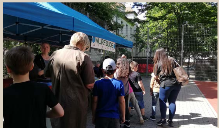
Wurfbude des Kinder- und Jugendhaus Linie 6