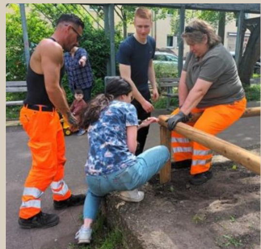
Zaubauaktion am Melanchthonplatz