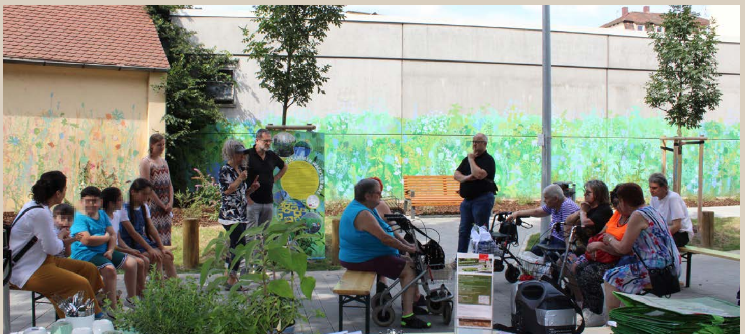
Impression der Einweihung