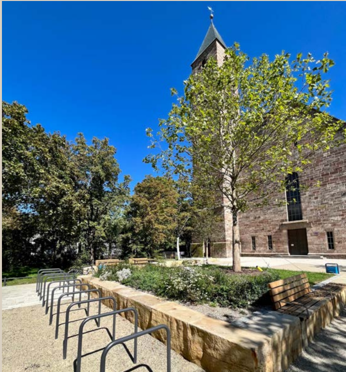
Ferigstellung des umgestalteten Platzes