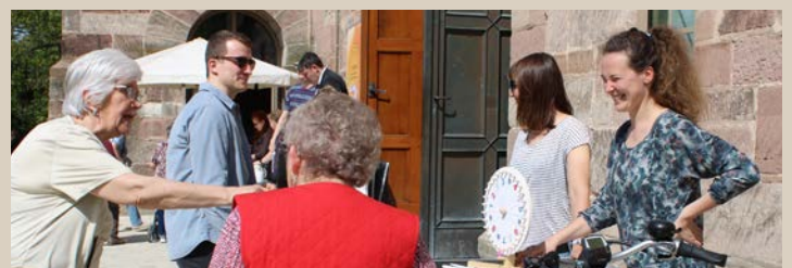
Glücksrad bei der KommVorZone

Mit Glücksrad, Äpfel schälen und Erinnerungsfotos im vergoldeten Rahmen endete die Einweihung bei strahlendem Sonnenschein.