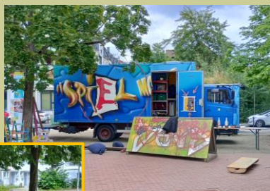
Spielmobil Mobbl Am Jamnitzerplatz

Das Team von Mobbl ergänzte das kreative Angebot der Obstbaumpatinnen und –paten im Quelle-Park im Rahmen des Sommerfests „Grüne Quelle“ am 5. Juli.