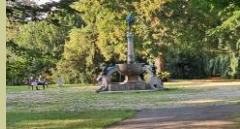
Jamnitzer Platz (unten)