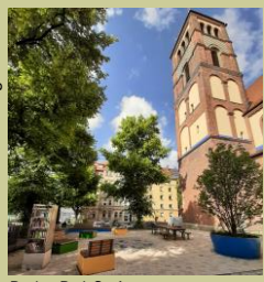
Pocket-Park St. Anton