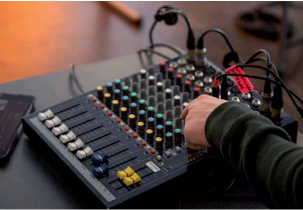
Technik und Kirche