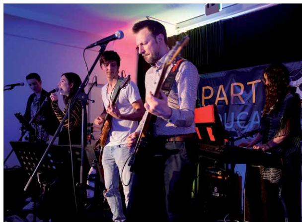
Music in the box

Höhepunkt war die Taufe eines Konfirmanden am Ende des Gottesdienstes. Im Anschluss gab es noch ein Buffet, das die Konfis organisiert haben. Hier blieb viel Zeit für Kennenlernen und Austausch.