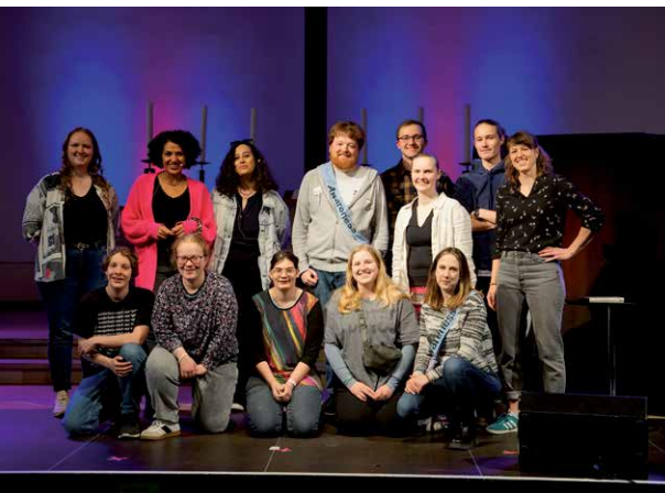
Kein Raum für Rassismus

Auch der Workshop am Sonntag war ein voller Erfolg. Anders als viel-