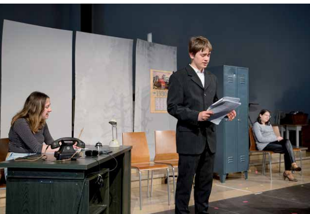
Alles nur Theater?