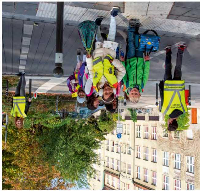
Schülerlotsen helfen bei der sicheren Überquerung der Straße.