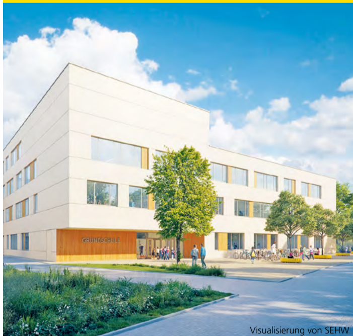
Visualisierung von SEHW