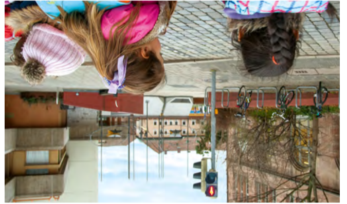
Bei Rot stehen bleiben – Kindern ein Vorbild sein!

„Kurze Beine, kurze Wege“ ist das Motto für unsere Schulanfängerinnen und Schulanfänger in Nürnberg. Ihr Kind kann das Schulhaus in seinem Schulsprengel erfahrungsgemäß zu Fuß erreichen.